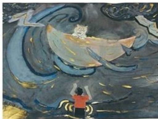
Vita di Pi